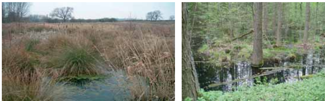
Slika 2. Serije malih jezera u Lodingtonu (Engleska, levo) i terase sezonskih jezera koje vraćaju nazad vodu nakon otapanja snega u Bjelovežu (Poljska, desno), jednoj od najprirodnijih evropskih šuma.

Strateški pozicionirana mreža jezera ima potencijal da zadrži vodu na mestu izvora, da napuni izdane i da smanji nivo zapremine vode pre nego nastane problem. Modeli urađeni u Engleskoj pokazali su da se instaliranjem rezervoara od 10.000 m 3 po kvadratnom kilometru (što otprilike odgovara zapremini deset jezera srednje veličine) mogu prihvatiti sve atmosferske vode, čak i od snažnih padavina, i tako značajno smanjiti gubitak vode. Pokazano je da mala jezera veličine od samo 3 m 2 mogu da „zadrže“ vodu koja bi otekla drenažom sa polja od 25 hektara, bez izlivanja. Ovi sistemi efektivno imitiraju ono što se može videti u prirodnim sistemima, gde voda ne teče kroz šumovitu dolinu, nego se preliva preko serije terasa privremenih jezera. (Slika 2).